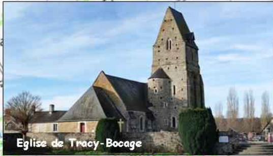
Eglise de Tracy-Bocage