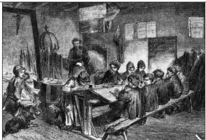
Ecole des champs

Une école vers 1880 : Dessin de Ferdinandus - Les instituteurs . G. Duveau Histoire du peuple français Tome 5