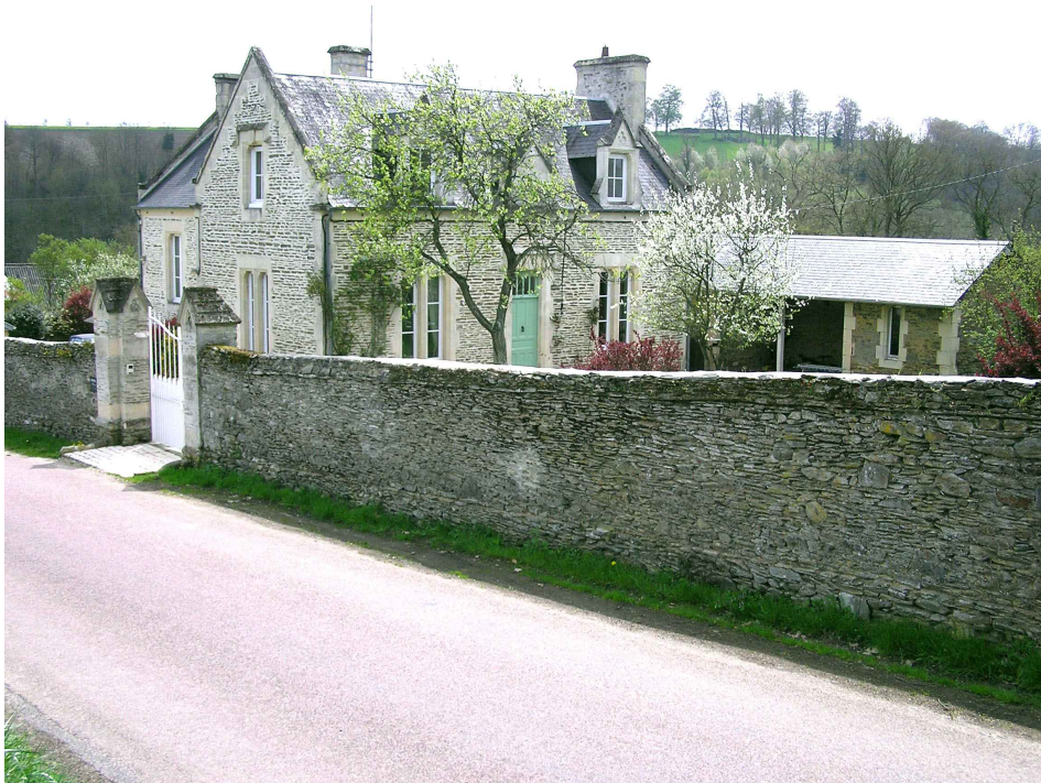
L'ancienne école de Parfouru fondée en 1878